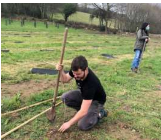
Plantation – Sulniac - 2019

Afin de préparer le territoire au changement climatique, Clim'actions Bretagne Sud anime le programme Forêt et Climat . Les plantations d'arbres permettent d'augmenter le stockage de carbone, favoriser la biodiversité et améliorer la qualité de l'air et paysagère.