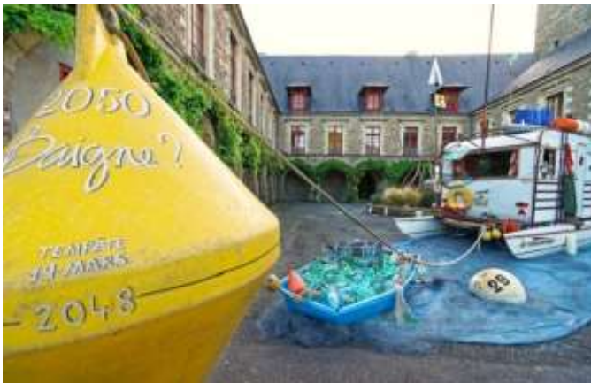
Exposition « ça baigne ? » - Vannes - 2020