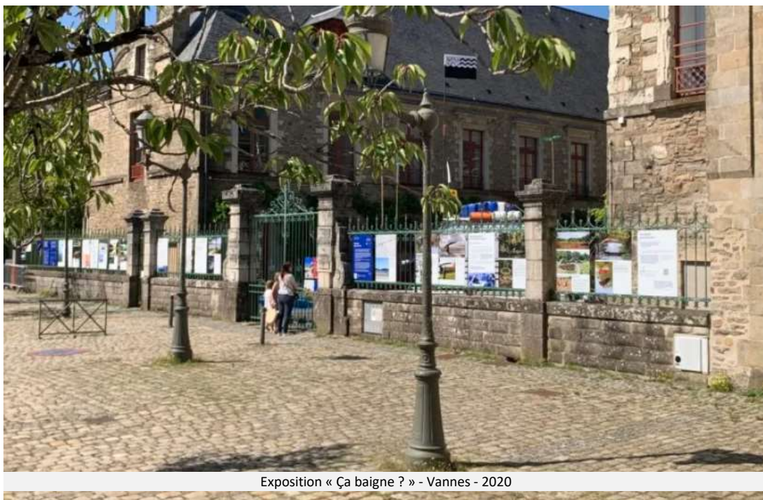
Exposition « Ça baigne ? » - Vannes - 2020

Le Golfe du Morbihan a été choisi comme l'un des territoires de l'étude. Co-Cli-Serv vise à tester les possibilités d'améliorer la prise de conscience par l'ensemble des acteurs d'un territoire face aux conséquences du changement climatique en construisant collectivement un "récit" du futur à la fois réalisable et mobilisateur. Le rôle spécifique de Clim'actions Bretagne sud, appuyé par l'équipe du PNR Golfe du Morbihan, était de réaliser un projet artistique permettant d'illustrer le récit et de faciliter son appropriation par les habitants de notre territoire, sous une forme encore à définir (exposition, recueil imprimé...).