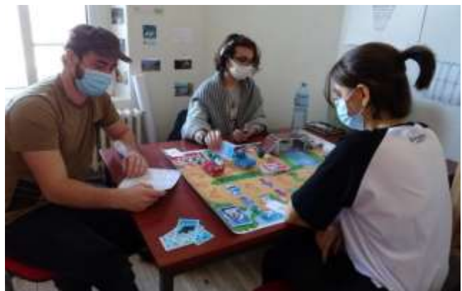
La fabrique du climat

Ces ateliers sont animés par des adhérents de Clim'actions qui ont le savoir-être et le savoir-faire pour partager leurs connaissances. Ces adhérents-formateurs s'engagent à respecter les statuts et la charte de Clim'actions Bretagne Sud.