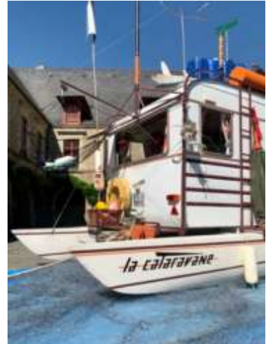
Exposition « ça baigne ? » - Vannes - 2020