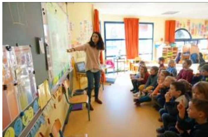
Programme Watty - 2020

Pour comprendre les économies d'énergie et d'eau dès la maternelle Clim'actions Bretagne Sud anime le programme Watty à l'école dans 90 classes du Morbihan et 6 à Lannion. Ce programme vise à sensibiliser les élèves aux économies d'énergie et d'eau en les rendant acteurs des consommations d'énergie et d'eau dans leur établissement et à leur domicile.