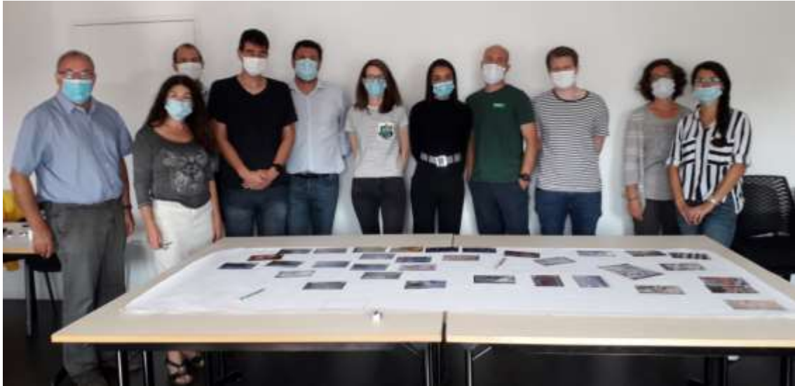
Programme Clim'impact -Atelier chez Optic Performance – Vannes -2020